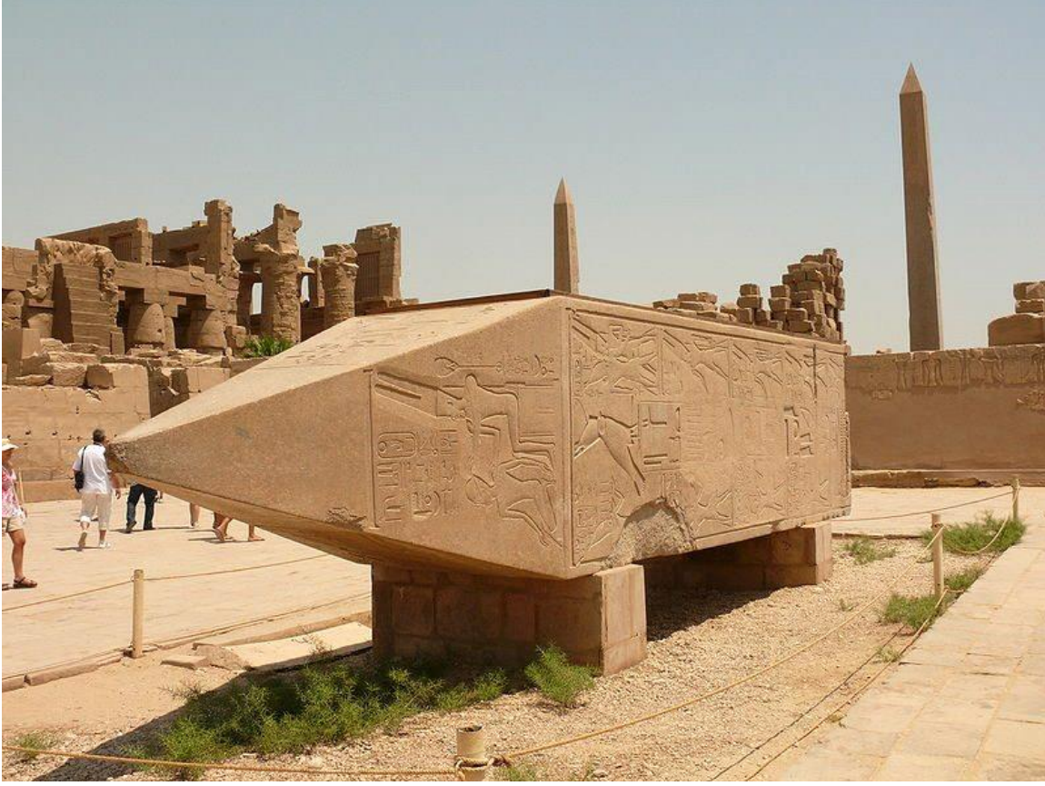
Hatşepsut obeliski (Karnak, Misir)

Uca Allah, bu ayələrdə Zilhiccə ayının bərəkət və əzəmətinə işarə edərək, bizləri bunun fərqinə varmağa, bu gözəlliklərdən faydalanmağa dəvət edir. Davamında isə, bol-bol nemətlər verərək ucaltdığı bir çox qövmlər/millətlərə diqqət çəkərək, tarix elmini oxumağa və ibrətlər alaraq, Allahın varlığı və bizləri, vermiş olduğu Cənnət şansını dəyərləndirməyə çağırır. Həmin millətlərin, məhz nankorluq edərək, Allahın yolundan azmaları, tövhid inancından uzaqlaşdıqları, habelə Uca Yaradanın əmr və qadağalarına məhəl qoymayaraq həddi aşmaları səbəbilə həlak edildikləri, inşa etdikləri möhtəşəm sənət əsərlərinin isə, bu gün sahibsiz olaraq bizlər üçün ibrət olaraq saxlanıldığı da, xüsusi olaraq xatırladılır: