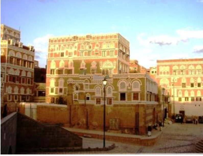
Səba mirası (Yəmən)