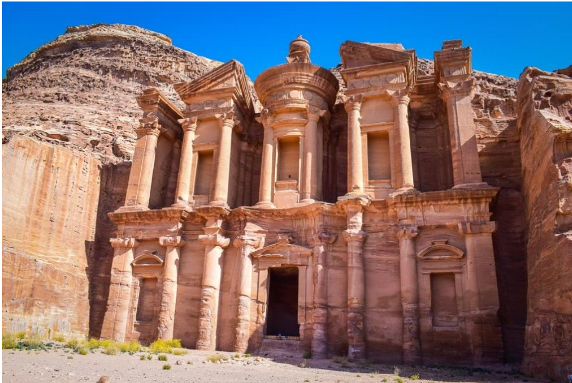
Tarixi Petra (İordaniya)

Haqqında bəhs olunan həmin qövm də, öz peyğəmbərlərinin gətirmiş olduğu haqq çağırısına məhəl qoymamış və beləcə həlak edilərək tarix səhnəsindən silinib getmişlər. Qurduqları şəhər tikililəri isə, insanlara ibrət olsun deyə, günümüzə qədər mövcudluğunu qorumuşdur. Nəbatilərin paytaxt şəhəri olan Petra: